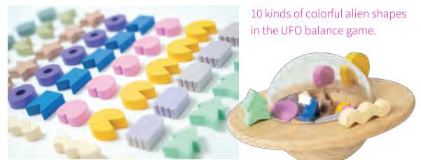
10 kinds of colorful alien shapes in the UFO balance game.

大事なものは、大人と子ども、どちらも happy になれるかどうか。なぜなら、おもちゃは親子をつなぐコミュニケーションツールだから。家族と一緒に遊んで、あたたかい時間を過ごして欲しいって願いながら、いつもおもちゃを作っているよ。そのためにもデザインは重要な要素！子どもがワクワクして、かつ大人も心地よいデザインを心がけています。kaz* は、色やかたちを考えるのがだいすき♡ 2022年に作った UFO というバランスゲームには、10種類の宇宙人が50人ついてくるんだけど、その宇宙人たちをデザインするのは楽しかったな！