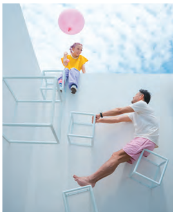
You can get to the rooftop by climbing these cubes.