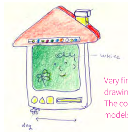
Very first sketch of gg*'s “oekaki house” drawing board design The colors are different from our current models - isn't it interesting?