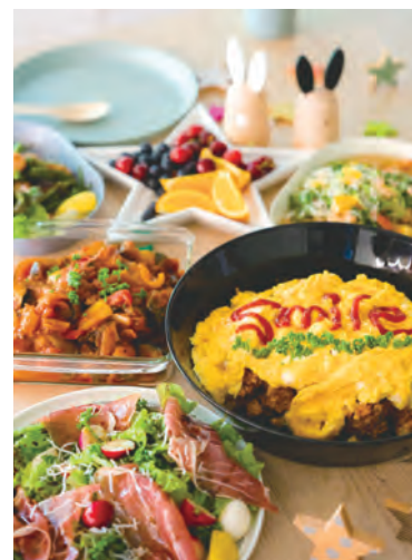
Super yummy and healthy too!