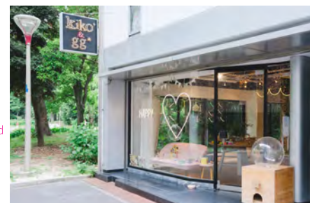
The flagship store is on the ground floor of the same building as the atelier. Fresh air and greenery can be enjoyed from the neighboring Utsubo park.