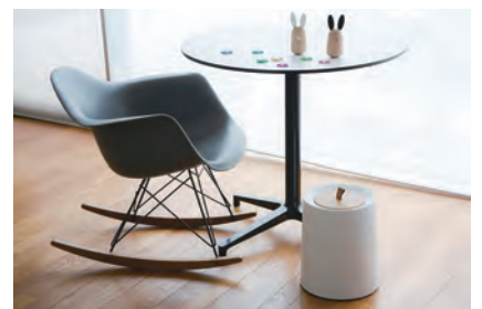
ideaco's signature trash can, TUBELOR HOMME

え？この家では？彼女が選んでくれて全然 OK。奥さまが happy なのが一番だよ。笑