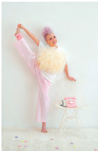
Favorite color? Pink of course :)