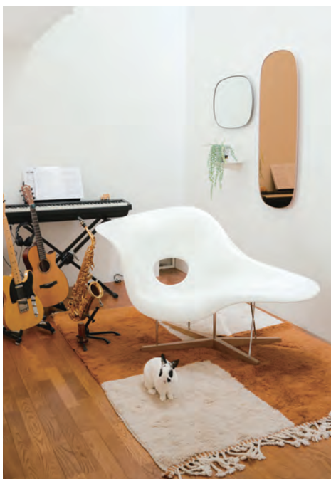
La Chaise / Charles & Ray Eames, 1948

▶ Can you show us around your house and tell us more about your favorite objects, brands and inspiration for interior design?